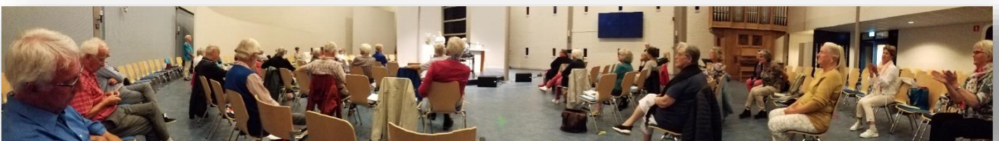
Repeteren op 1,5 m onderlinge afstand met voldoende ventilatie

Na de aangekondigde versoepelingen van afgelopen mei, en vanwege het feit dat (bijna) alle koorleden twee keer gevaccineerd zijn, durfde het bestuur de repetities weer op te pakken. En zo repeteren we sinds