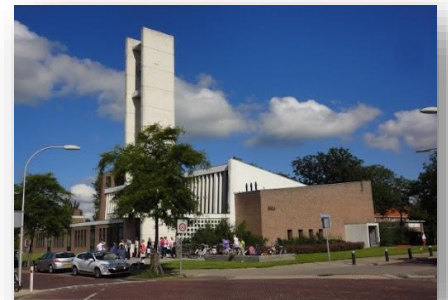
Het Kruispunt in de Van Nesstraat

Na de aangekondigde versoepelingen van afgelopen mei, en vanwege het feit dat (bijna) alle koorleden twee keer gevaccineerd zijn, durfde het bestuur de repetities weer op te pakken. En zo repeteren we sinds