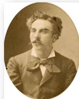
Gabriel Fauré (1845-1924)

behoorlijk wat inventiviteit en creativiteit. Zo weten we bijvoorbeeld op het moment van dit schrijven nog niet hoeveel toehoorders we in de Adventskerk mogen toelaten; of op 2 november de 1,5 m. maatregel nog geldt of dat mogelijk de laatste Coronamaatregelen al zijn afgeschaft. We zijn daarbij afhankelijk van de overheidsmaatregelen, die we nu nog niet kennen en die nog kunnen veranderen. Overigens lijkt het wel waarschijnlijk dat er Coronachecks zullen moeten plaatsvinden bij de ingang van de kerk, waar toehoorders mee geconfronteerd zullen worden. Uiteraard zullen we alles in het werk stellen om ervoor te zorgen dat dit concert een heel bijzonder concert zal worden, juist omdat we weer mogen zingen en dat ook ten gehore mogen brengen. Om zoveel mogelijk mensen in de gelegenheid te stellen dit concert te kunnen beluisteren, zullen we voor het eerst in het bestaan van ons koor dit concert gaan 'livestreamen'. Een ander nieuw gegeven is dat er kaarten via de website besteld kunnen gaan worden. Natuurlijk houden we ook vast aan de verkoop door de koorleden, maar we willen ook digitale verkoop mogelijk gaan maken. Zodra dit mogelijk is, plaatsen we het op onze website oratoriumkooralphen.nl .